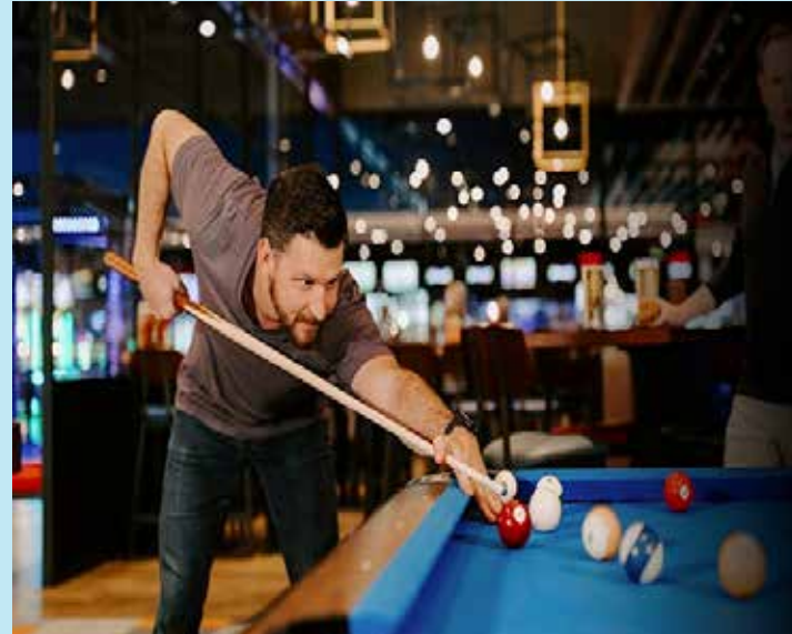
BILLIARD BLISS Step into a world where elegance meets excitement