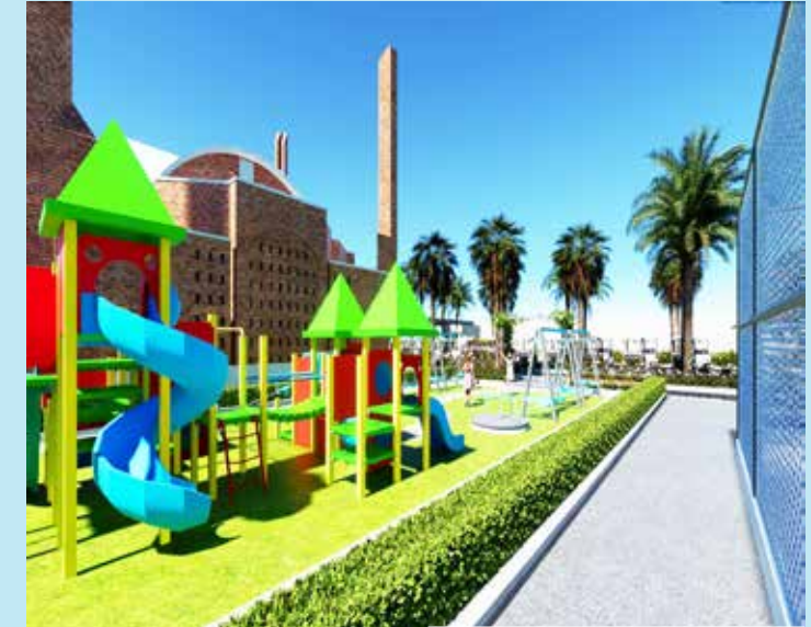
KIDS' PLAY ZONE A World of Fun & Adventure