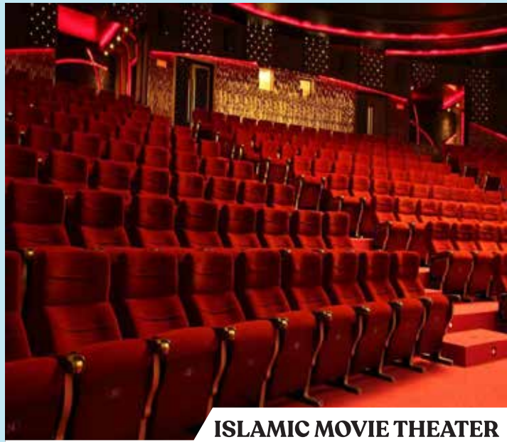
ISLAMIC MOVIE THEATER An Immersive Movie Experience