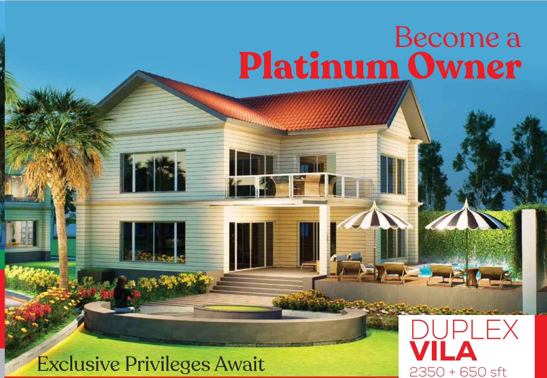
DUPLEX VILA 2350 + 650 sft