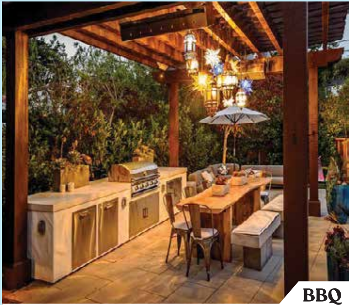
BBQ A Feast of Flavor & Fun