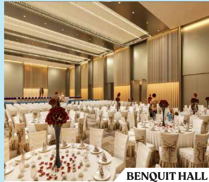
BENQUIT HALL At Istanbul Hotel & Resort