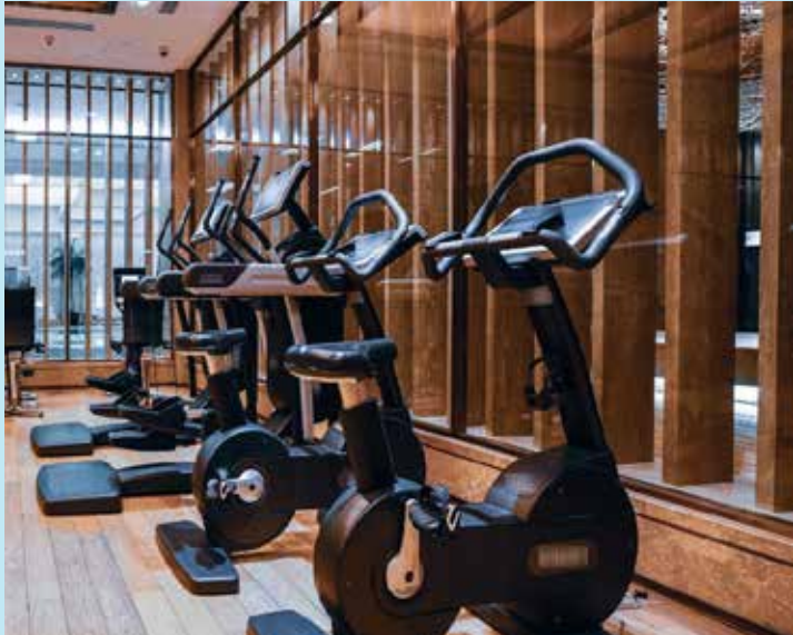
MODERN GYMNASIUM A State-of-the-Art Fitness Hub