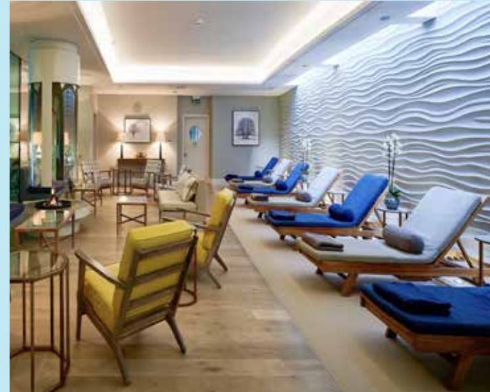
SPA CENTER Serenity Awaits at the Spa Center