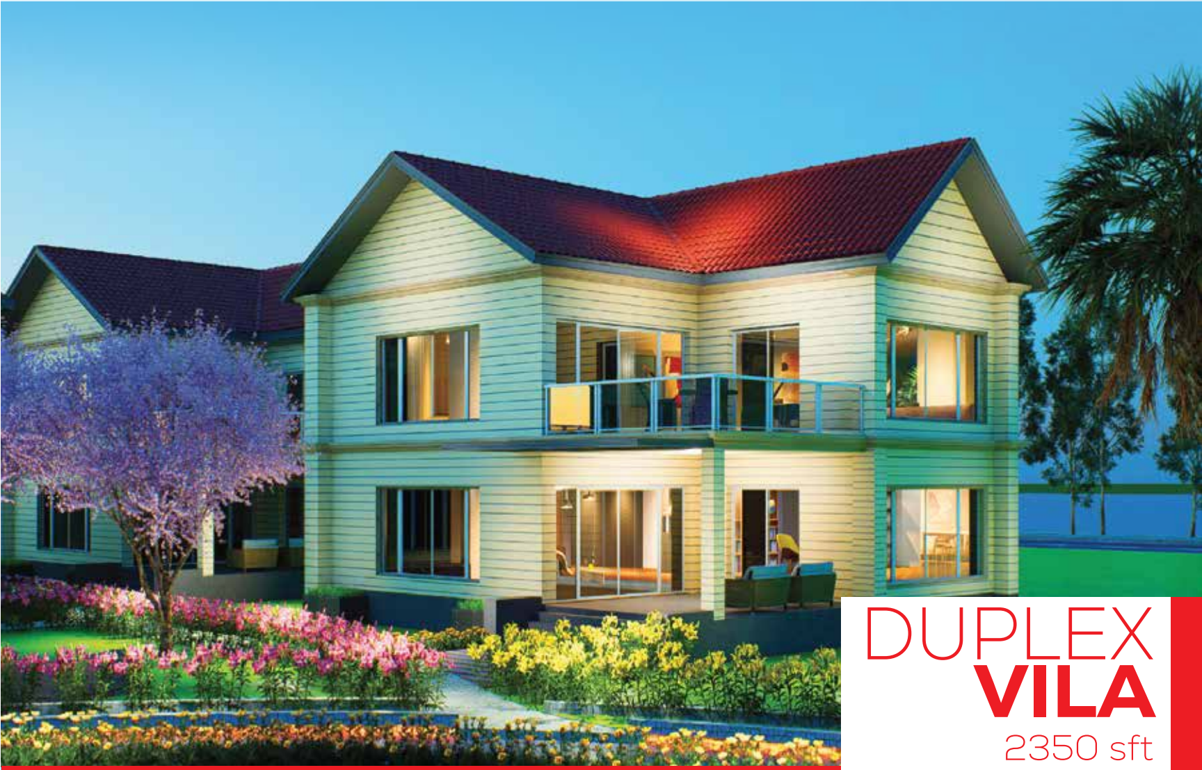
DUPLEX VILA 2350 sft