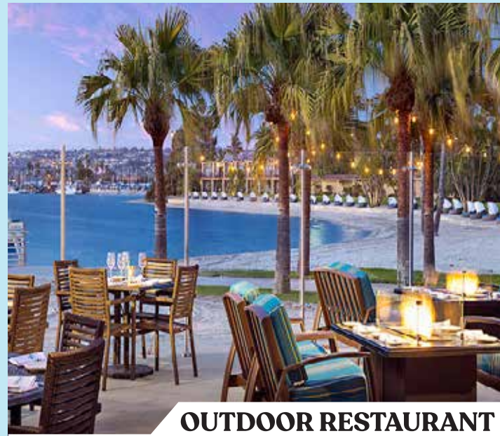
OUTDOOR RESTAURANT A Culinary Journey Awaits