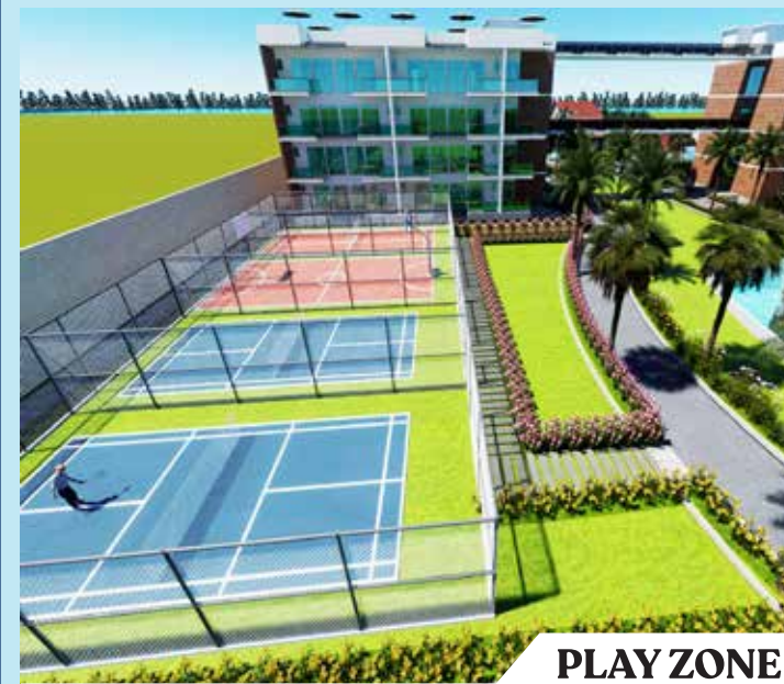
PLAY ZONE A Hub of Fun & Excitement