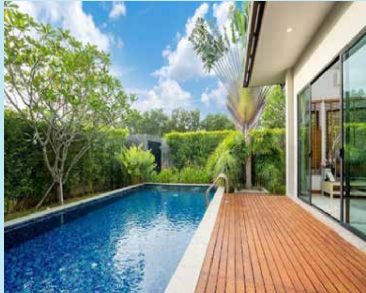
LUXURY SWIMMING POOL A Retreat of Tranquility & Elegance