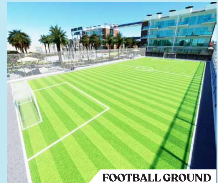
FOOTBALL GROUND A Field of Passion & Competition