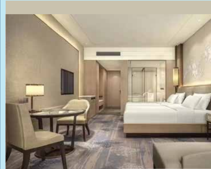
ROOM RENT Luxurious King Bed Room